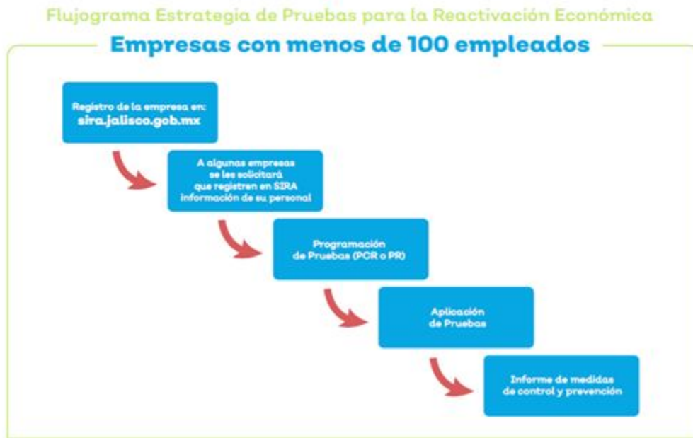
Figura 1. Flujograma estrategia de pruebas para la reactivación económica, en empresas con menos de 100 empleados.